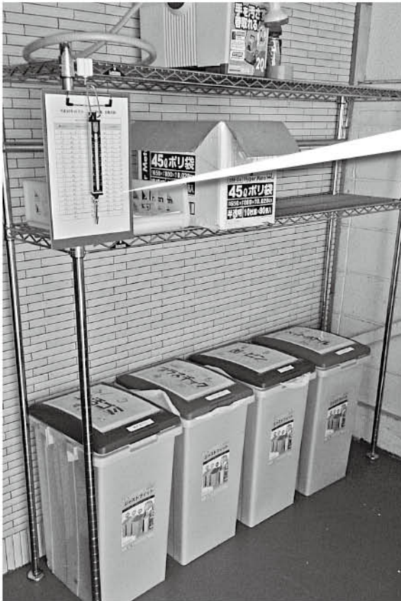
ゴミ捨て場に記録用紙を設置しています