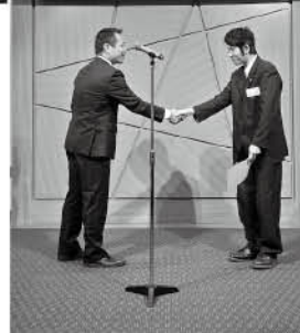
研修修了証書授与

る3S活動と連動し、更にはサービスの質の向上にも繋がるよう全社一丸となって奮闘しています。