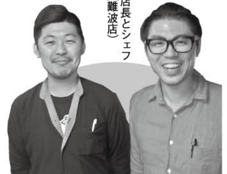
店長とシエ ファ (難波店)